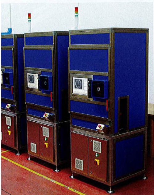
Unità Contro Camera pronte per la spedizione a un cliente. / Counter camera units ready for shipment to a customer.

La convenienza per i nostri clienti di lavorare con noi deriva