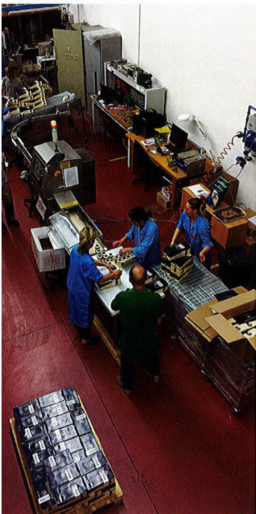
Ricontrollo prodotti per un cliente./ Product recheck for a customer.

dal fatto che da sempre abbiamo avuto un'attenta gestione di ogni progetto, cioè una reale customer care che nella nostra filosofia è la migliore "promozione" dell'azienda.